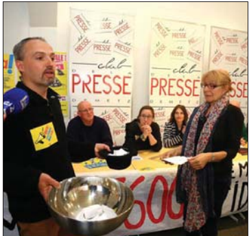
Les candidats de Basta ! ont été tirés au sort parmi quatorze participants.