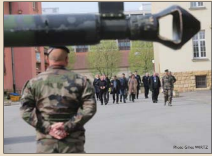
Hier, le 3 e régiment de Huszards de Metz a présenté les métiers de la défense à une délégation de douze chefs d'entreprises locales et représentants de grandes enseignes nationales. L'objectif ? Faciliter la reconversion professionnelle des militaires après leur carrière.